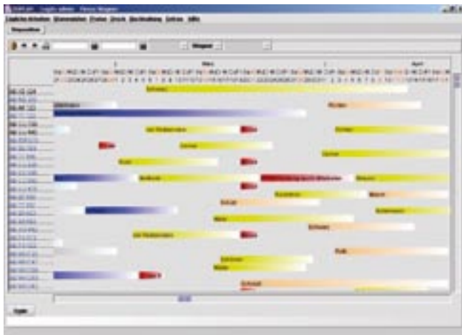
Die Plantafel, Dreh- und Angelpunkt von isiplan

Alle Ihre Fahrzeuge werden für Sie auf einer grafischen Plantafel dargestellt. Durch die unterschiedlichen Farben der Balken (die jeweils ein Mietereignis darstellen), sehen Sie sofort, ob es sich um ein Angebot, einen Mietvertrag, einen Check-Out, usw. handelt.